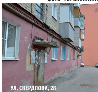
УЛ. СВЕРДЛОВА, 28

Подобные проблемы в каждом втором подъезде на Южной Поляне.