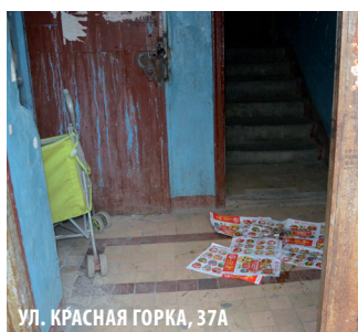
УЛ. КРАСНАЯ ГОРКА, 37А