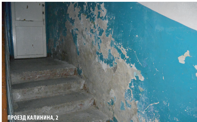
ПРОЕЗД КАЛИНИНА, 2