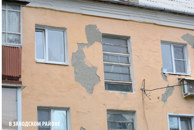
В ЗАВОДСКОМ РАЙОНЕ