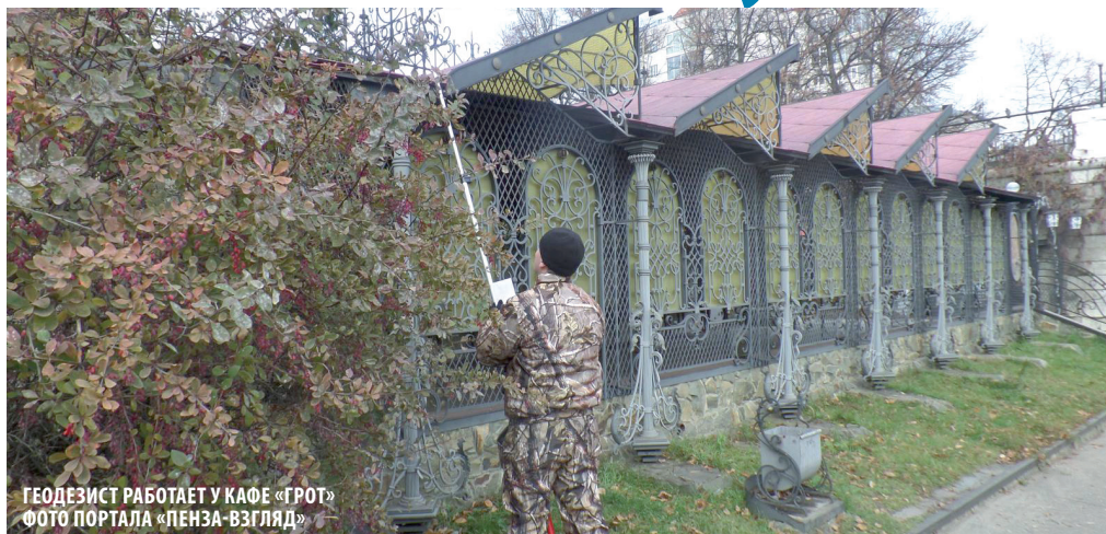
ГЕОДЕЗИСТ РАБОТАЕТ У КАФЕ «ГРОТ»

«Горожанин» в одном из последних номеров рассказал о том, как делят землю в городе. Речь шла о формировании и использовании земельных участков под жилыми домами, детсадом и кафе в центре города.