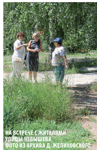
НА ВСТРЕЧЕ С ЖИТЕЛЯМИ УЛИЦЫ ЧЕБЫШЕВА

Однако работа по наказам избирателей невозможна без самих наказов. Чтобы проблемы решались, первый шаг должны сделать сами жители, заявить о них, предать огласке. И только благодаря совместной активной работе всех горожан Пенза станет благоустроенным городом, комфортным для жизни.