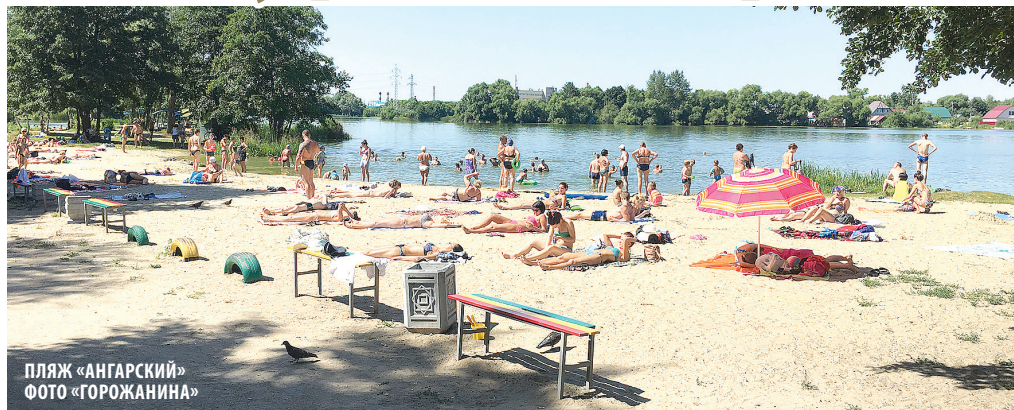
ПЛЯЖ «АНГАРСКИЙ»