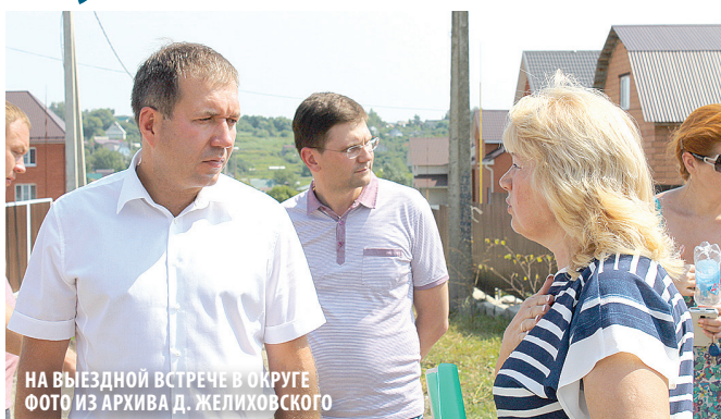
НА ВЫЕЗДНОЙ ВСТРЕЧЕ В ОКРУГЕ