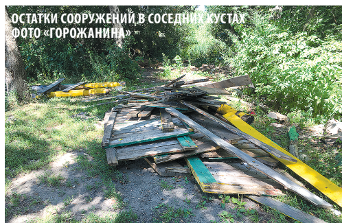
ОСТАТКИ СООРУЖЕНИЙ В СОСЕДНИХ КУСТАХ