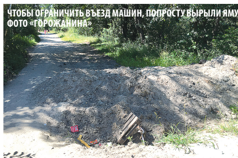
ЧТОБЫ ОГРАНИЧИТЬ ВЪЕЗД МАШИН, ПОПРОСТУ ВЫРЫЛИ ЯМУ

и впрямь видна невооруженным глазом. Видимо, мусор и другие последствия отдыха горожан здесь собирают и вывозят регулярно. Конечно, «Ангарскому» до Ниццы еще далеко. Но первые шаги в сторону «европейского» отдыха уже сделаны. Завезен чистый песок, установлены кабинки для переодевания и беседки, лавочки и урны, биотуалет и контейнеры для мусора. Оборудованы волейбольная и футбольная площадки.