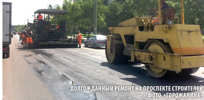
ДОЛГОЖДАННЫЙ РЕМОНТ НА ПРОСПЕКТЕ СТРОИТЕЛЕЙ