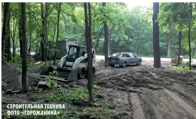
СТРОИТЕЛЬНАЯ ТЕХНИКА

В Пензе официально числится 140 скверов и четыре парка. Они имеют статус особо охраняемых зеленых зон. Однако границы этих зон до сих пор не определены. Большинство из них не размежеваны и не поставлены на кадастровый учет. Защищать их от вырубки и произвола зачастую невозможно.