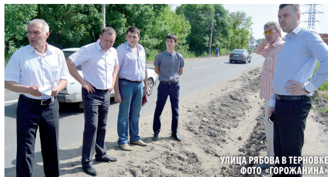
УЛИЦА РЯБОВА В ТЕРНОВКЕ

— В этом году мы уделяем особое внимание качеству работ. Каждый рубль на счету. Контроль за качеством ремонта осуществляет департамент ЖКХ Пензы, отобранные дорожные лаборатории и независимые эксперты из Пензенского строи-