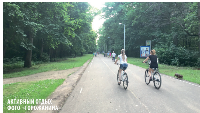
АКТИВНЫЙ ОТДЫХ ФОТО «ГОРОЖАНИНА»

то называются фитнес-бургерами. Бизнес на Олимпийской аллее процветает. А как же чувствуют себя отдыхающие?