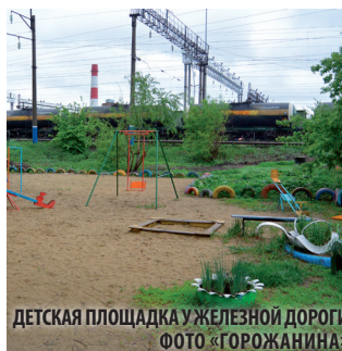
ДЕТСКАЯ ПЛОЩАДКА У ЖЕЛЕЗНОЙ ДОРОГИ ФОТО «ГОРОЖАНИНА»

годарны. В этом году по депутатской программе будет проводиться только ямочный ремонт.