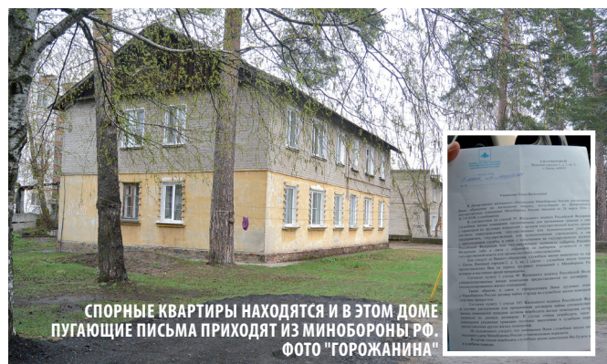
СПОРНЫЕ КВАРТИРЫ НАХОДЯТСЯ И В ЭТОМ ДОМЕ ПУГАЮЩИЕ ПИСЬМА ПРИХОДЯТ ИЗ МИНОБОРОНЫ РФ. ФОТО "ГОРОЖАНИНА"