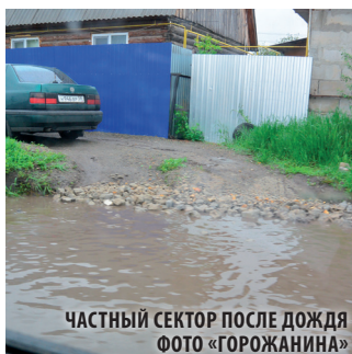
ЧАСТНЫЙ СЕКТОР ПОСЛЕ ДОЖДЯ