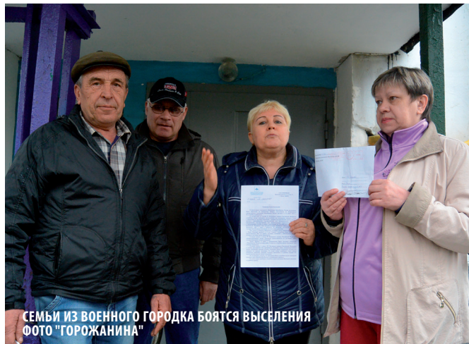
СЕМЬИ ИЗ ВОЕННОГО ГОРОДКА БОЯТСЯ ВЫСЕЛЕНИЯ

правит ходатайство в территориальное отделение Управления жилищного обеспечения Минобороны России, чтобы снять данные квартиры с оперативного управления и передать муниципалитету. Целесообразность в сохранении данных квартир как служебного жилья отпала уже много лет назад, когда в окрестностях городка была закрыта последняя войсковая часть. Расквартировывать больше некого.