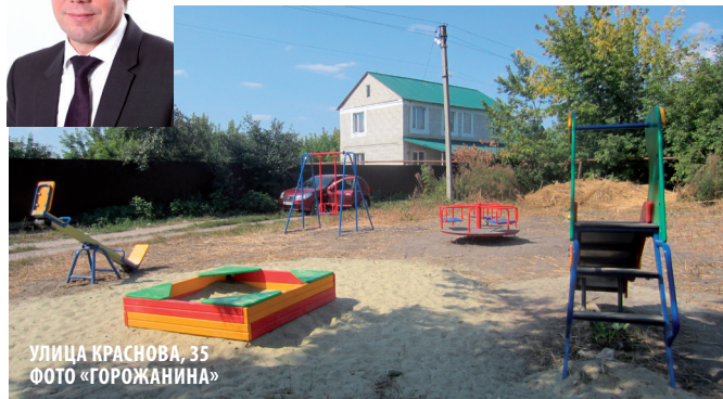
УЛИЦА КРАСНОВА, 35