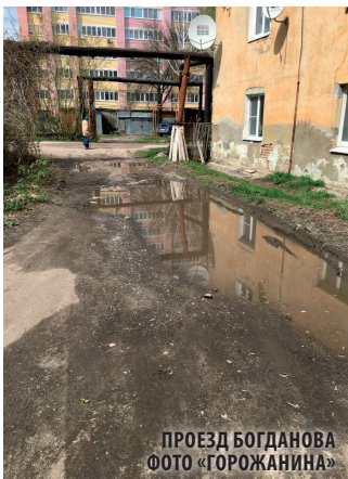
ПРОЕЗД БОГДАНОВА