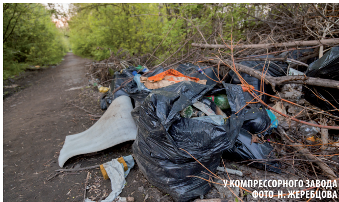
У КОМПРЕССОРНОГО ЗАВОДА

Снимки из сквера с легкостью можно перепутать с кадрами, сделанными в заброшенной Припяти.