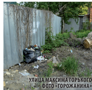
УЛИЦА МАКСИМА ГОРЬКОГО