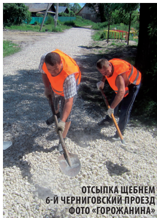
ОТСЫПКА ЩЕБНЕМ 6-Й ЧЕРНИГОВСКИЙ ПРОЕЗД

стабильной подачи электроэнергии в микрорайоне.