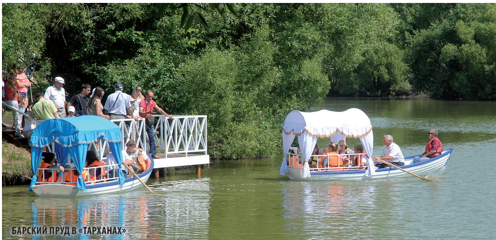
БАРСКИЙ ПРУД В «ТАРХАНАХ»

Как потратить минимум денег и получить максимум удовольствия в выходные