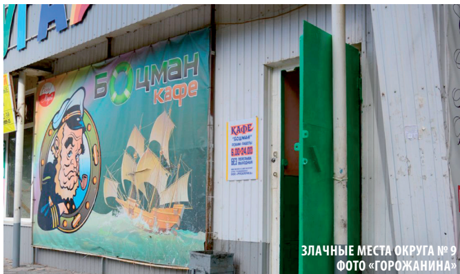
ЗЛАЧНЫЕ МЕСТА ОКРУГА № 9