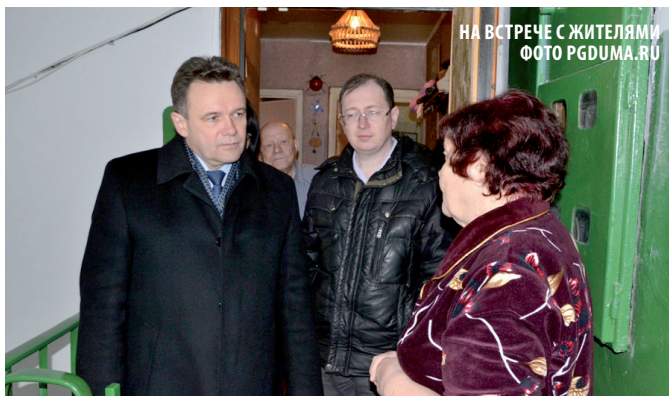
НА ВСТРЕЧЕ С ЖИТЕЛЯМИ

Улица Урицкого пугает видом ветхих домов, которые никак не расселят. На острове Пески признаки цивилизации теряют четкие очертания. Разбитые дороги, горы мусора, заросшие участки. У каждого из них есть собственник, но хозяев никто не штра-