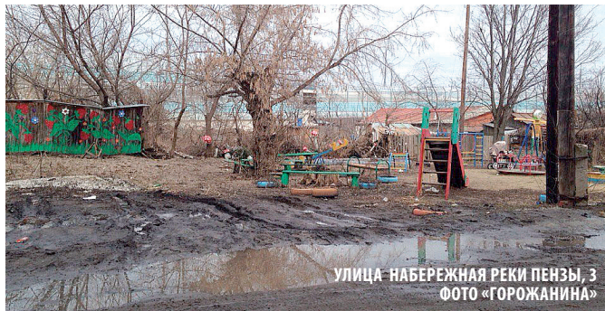
УЛИЦА НАБЕРЕЖНАЯ РЕКИ ПЕНЗЫ, 3 ФОТО «ГОРОЖАНИНА»

фует за ненадлежащее состояние. На весь остров единственная детская площадка, больше похожая на зону отчуждения.