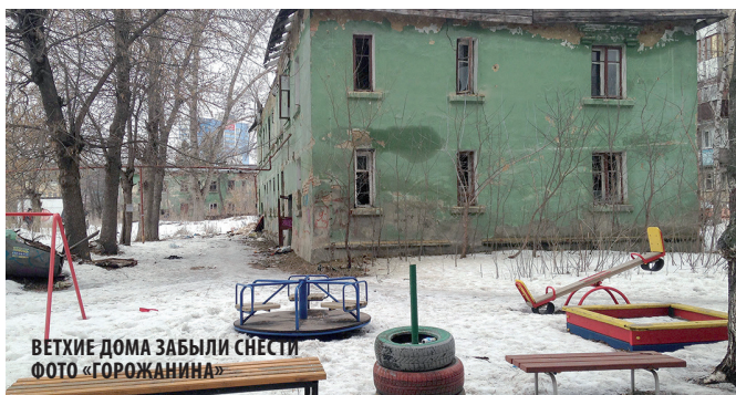
ВЕТХИЕ ДОМА ЗАБЫЛИ СНЕСТИ

– В микрорайоне новостроек уже много лет стоят развалившиеся двухэтажные дома. Жильцов расселили, заброшенные строения стали пристанищем для сомнительных посетителей. В пяти метрах от одного из них расположена детская площадка. Когда наведут порядок?