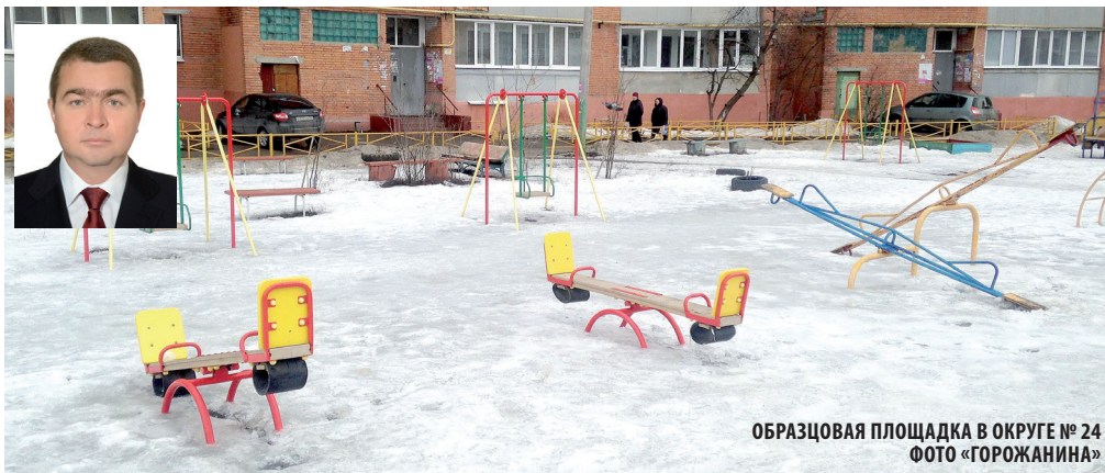
ОБРАЗЦОВАЯ ПЛОЩАДКА В ОКРУГЕ № 24

Одна из последних касается тарифа на обслуживание жилого фонда. Сергей Лисовол предложил утвердить для каждого типа жилых домов индивидуальный тариф. В первую очередь это касается убыточных домов, которые не хотят брать на баланс управляющие компании.