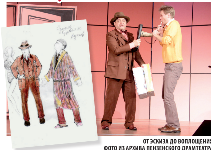
ОТ ЭСКИЗА ДО ВОПЛОЩЕНИЯ

играть разные актеры, для каждого шьется отдельный костюм, причем они могут сильно отличаться. Каждый актер создает собственный образ. В пошивочном цехе трудятся пять человек. Между ними существует строгое разграничение: одни шьют женские, другие – только мужские костюмы. Правда, последним иногда приходится кроить пышные юбки, если актеры-мужчины задумают на сцене переодеться в женское платье.