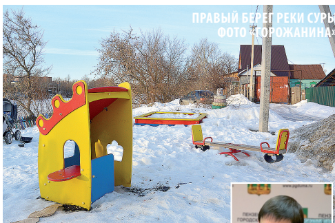
ПРАВЫЙ БЕРЕГ РЕКИ СУРЫ ФОТО «ГОРОЖАНИНА»

– В планах сделать парковку зону для отдыха. Ведем переговоры с РЖД о благоустройстве сквера у Привокзальной площади. Надеюсь, что город все же приведет в