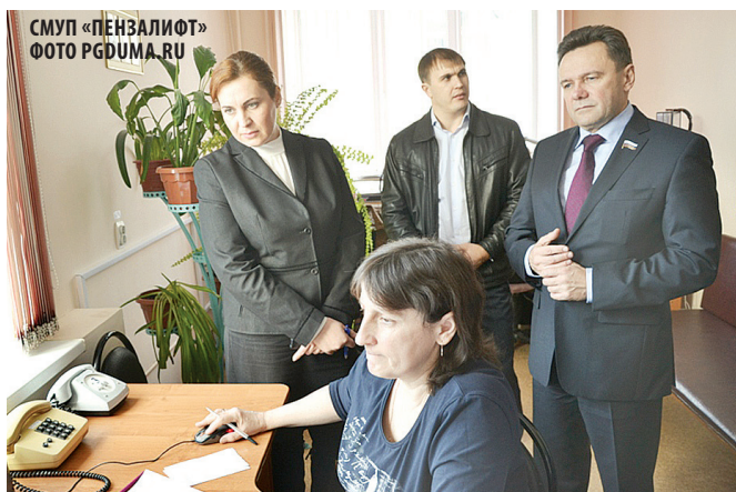
СМУП «ПЕНЗАЛИФТ»

Побывав на сенном рынке в Терновке, они словно совершили невольное путешествие