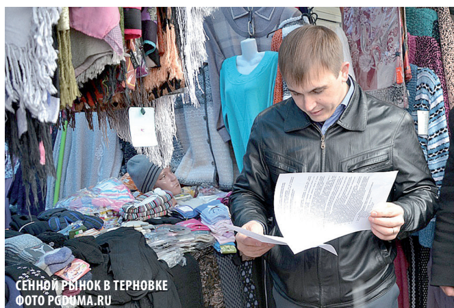
СЕННЫЙ РЫНОК В ТЕРНОВКЕ