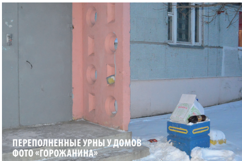
ПЕРЕПОЛНЕННЫЕ УРНЫ У ДОМОВ

Шуист – так называется не только рынок, но и микрорайон Пензы. Если верить истории происхождения топонимов, он назван в честь местности, изобиловавшей озерами, болотами, старицами Суры. В переводе с мордовского «шй» – болото, с буртасского «ис» – вода, река. При этом в мордовском языке окончание -т является показателем множественности. Вот и получается, что здесь находятся «болотистые места».