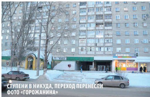
СТУПЕНИ В НИКУДА, ПЕРЕХОД ПЕРЕНЕСЛИ ФОТО «ГОРОЖАНИНА»