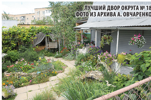
ЛУЧШИЙ ДВОР ОКРУГА № 18