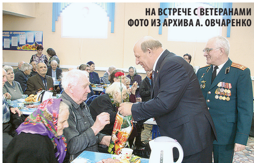
НА ВСТРЕЧЕ С ВЕТЕРАНАМИ