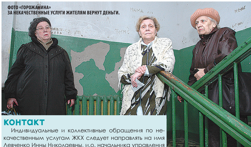
ФОТО «ГОРОЖАНИНА» ЗА НЕКАЧЕСТВЕННЫЕ УСЛУГИ ЖИТЕЛЯМ ВЕРНУТ ДЕНЬГИ.

Об этом говорится в Федеральном законе РФ от 29 июня 2015 г. № 176-ФЗ «О внесении изменений в Жилищный кодекс РФ и отдельные законодательные акты»: «При предоставлении коммунальных услуг с перерывами, превышающими установ-