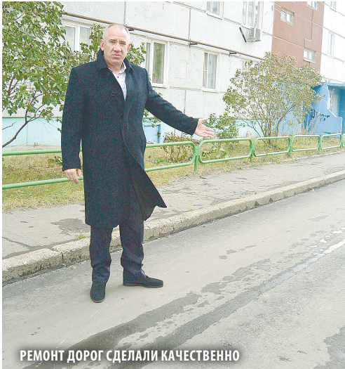
РЕМОНТ ДОРОГ СДЕЛАЛИ КАЧЕСТВЕННО