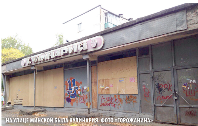
НА УЛИЦЕ МИНСКОЙ БЫЛА КУЛИНАРИЯ.