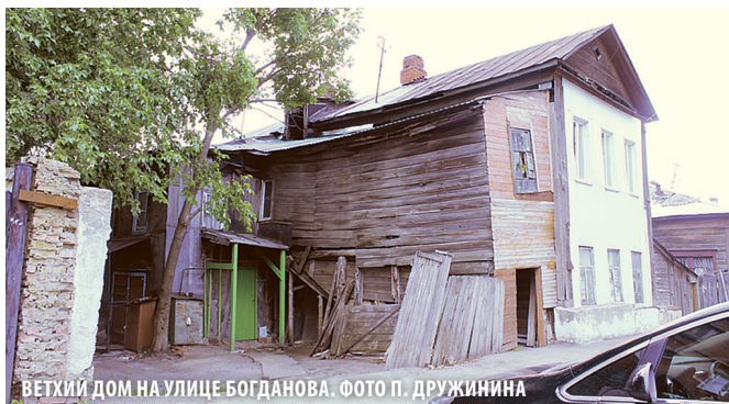
ВЕТХИЙ ДОМ НА УЛИЦЕ БОГДАНОВА. ФОТО П. ДРУЖИНИНА

могла бы приносить доход в городской бюджет.