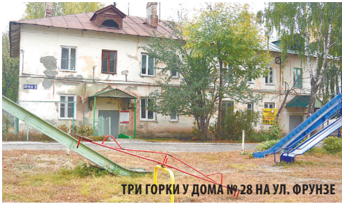
ТРИ ГОРКИ У ДОМА №28 НА УЛ. ФРУНЗЕ