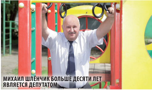
МИХАИЛ ШЛЁНЧИК БОЛЬШЕ ДЕСЯТИ ЛЕТ ЯВЛЯЕТСЯ ДЕПУТАТОМ