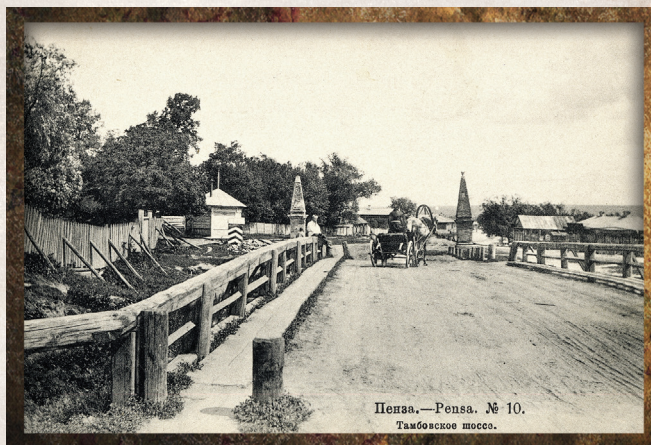
Пенза, —Pensa. № 10. Тамбовское шоссе.