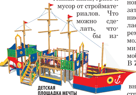
ДЕТСКАЯ ПЛОЩАДКА МЕЧТЫ