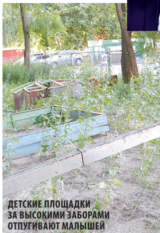
ДЕТСКИЕ ПЛОЩАДКИ ЗА ВЫСОКИМИ ЗАБОРАМИ ОТПУГИВАЮТ МАЛЫШЕЙ

и без того наминают гетто. Когда в них появляются еще и заборы в человеческий рост, хочется бежать куда глаза глядят.