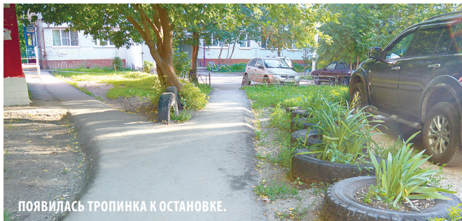
Появилась тропинка к остановке.