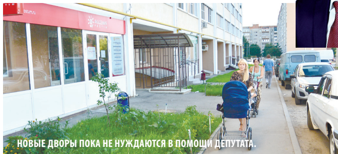
НОВЫЕ ДВОРЫ ПОКА НЕ НУЖДАЮТСЯ В ПОМОЩИ ДЕПУТАТА.