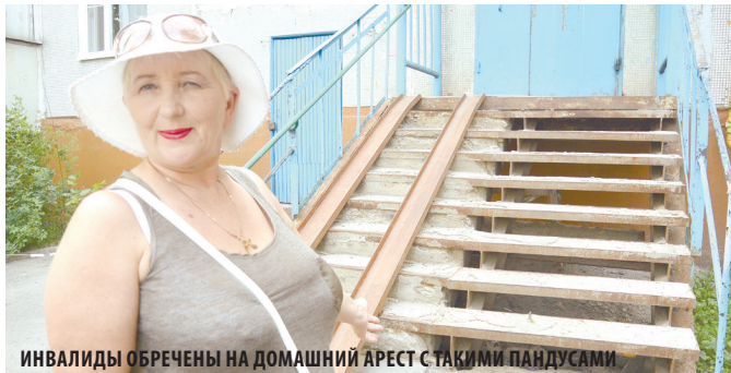
ИНВАЛИДЫ ОБРЕЧЕНЫ НА ДОМАШНИЙ АРЕСТ С ТАКИМИ ПАНДУСАМИ

Округ № 2 в Арбекове – динамично развивающийся район и самый густозаселенный. Здесь проживает более 14 тысяч избирателей, столько нет ни в одном другом округе.