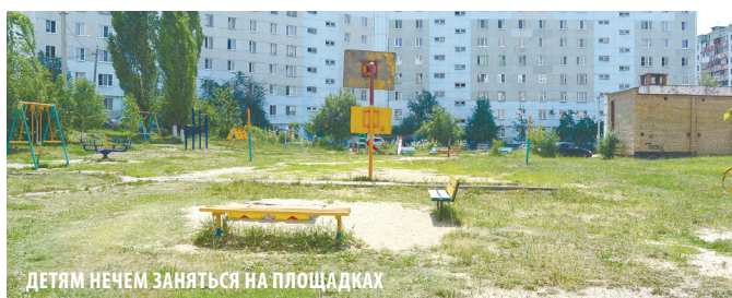
ДЕТЯМ НЕЧЕМ ЗАНЯТЬСЯ НА ПЛОЩАДКАХ

В микрорайоне есть Арбековский пруд, который в жаркие дни притягивает к себе сотни отдыхающих. Но территория пляжа не благоустроена. Берега заросли кустами, дно пруда не очищалось много лет. Местные власти запретили здесь купаться. Жемчужина микрорайона превратилась в гиблое место, хотя оно могло бы стать украшением Арбекова.