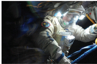
ФОТО КОСМОНАВТОВ С МКС

ного расписания. В невесомости все равно где спать, главное – надежно зафиксировать тело. На МКС спальные мешки с молниями прикреплены прямо к стенам. В российском сегменте есть иллюминаторы, через них перед сном можно любоваться видом Земли. У американцев «окон» нет.