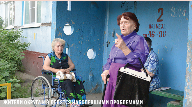
ЖИТЕЛИ ОКРУГА №3 ДЕЛЯТСЯ НАБОЛЕВШИМИ ПРОБЛЕМАМИ

– Я так понимаю, что депутат – это наш помощник во всем. Он бы дал нам свой телефон и сказал: обращайтесь в любое время по любым вопросам. А так я даже не знаю, как его найти. Интернета у меня нет. А депутат должен быть доступен для людей.