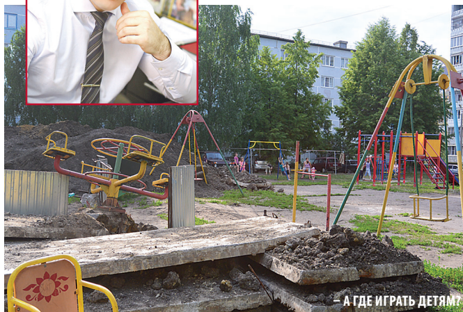
— А ГДЕ ИГРАТЬ ДЕТЯМ?

назад заложили шесть тысяч квадратных метров торговых и производственных площадей. Затем здание расширили, оборудовали парковку, при этом жильцы утверждают, что у них забрали часть дороги и земли. Автомобили местных жителей на нее не пускали.