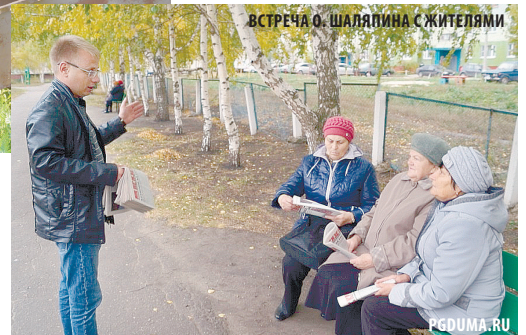
ВСТРЕЧА О. ШАЛАПИНА С ЖИТЕЛЯМИ