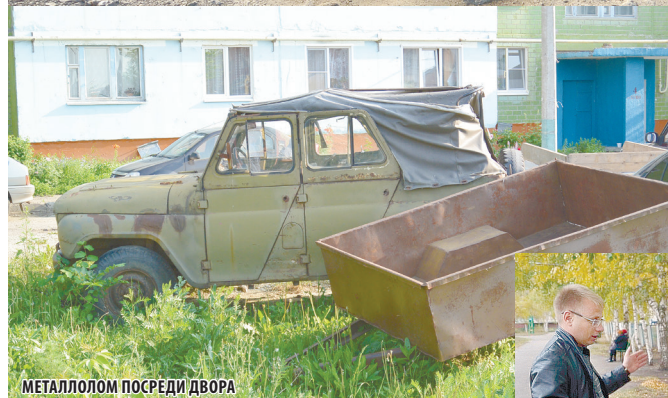
МЕТАЛЛОМ ПОСРЕДИ ДВОРА